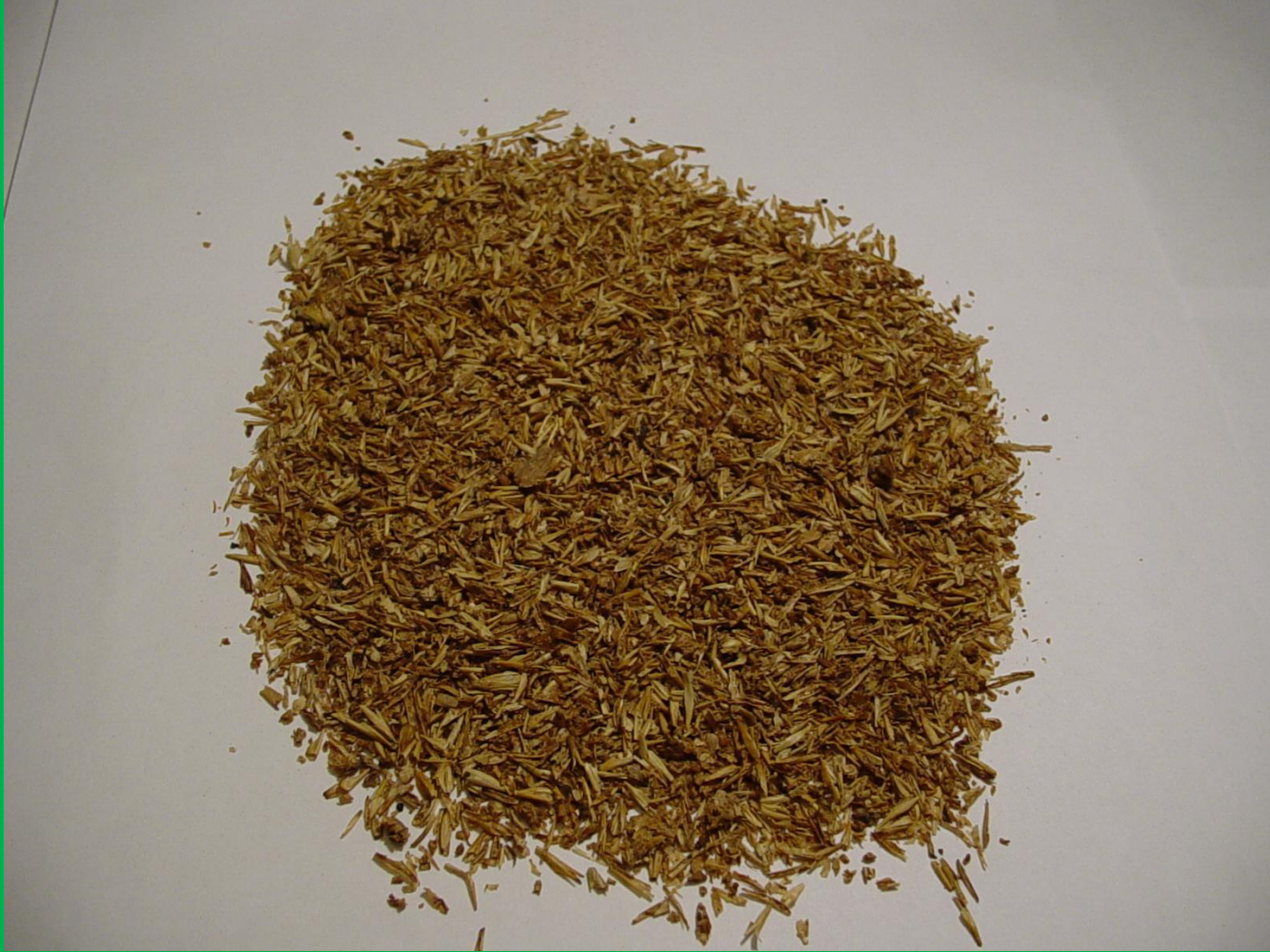
Yaş malt posası (brewers grain wet) (arpa kavuzlarına dikkat)