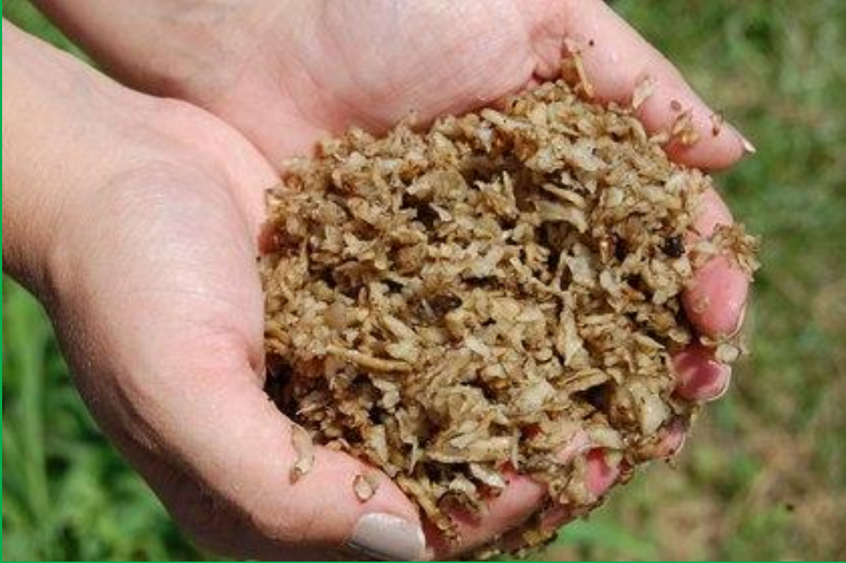
Yaş şeker pancar posası