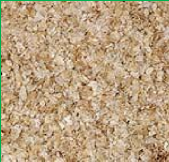
Buğday kepeği (wheat bran)