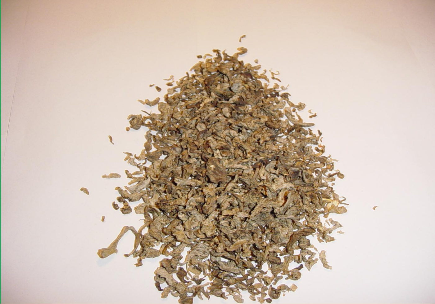
Kuru şeker pancarı posası (beet pulp dried)